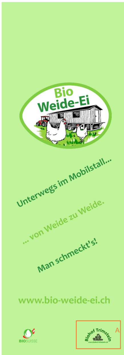
Abbildung 3: Flagge