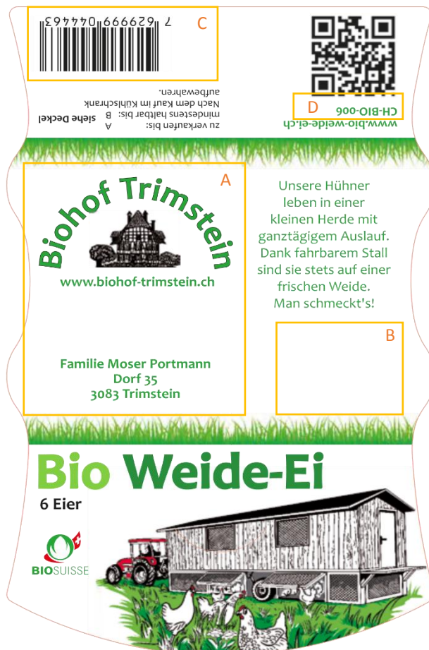
Abbildung 2: Etikette Eierschachtel 6er

Alle anderen Elemente der Etikette sind zwingend. Gestaltung der 10er Schachtel ist sinngemäss auszuführen. Farbe Schachtel: Nestpack „Kent Green“ (oder gleiche Farbe)